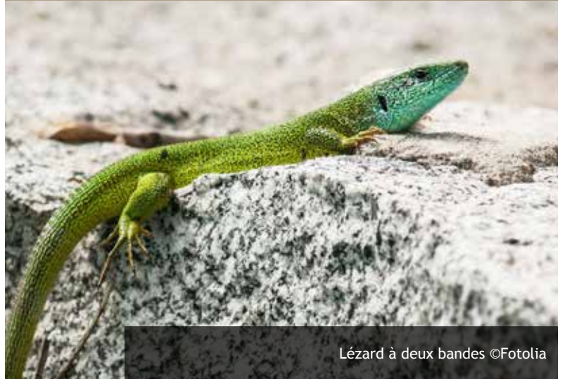
Lézard à deux bandes