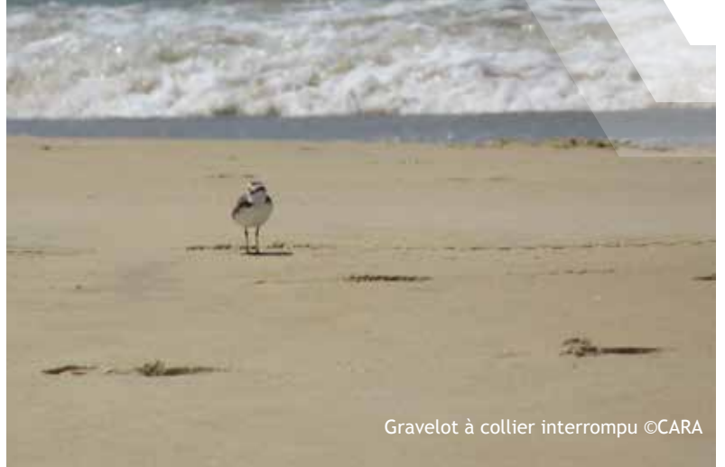
Gravelot à collier interrompu

La côte sauvage fait partie des 8 secteurs de l'étude , sur un linéaire de près de 24 km entre La Cèpe et la pointe du Rhin (extrémité de la flèche de bonne Anse). Une analyse du patrimoine naturel a été réalisée sur l'avifaune (oiseaux), la flore, les autres espèces animales et les habitats naturels. De par sa position intermédiaire entre la partie marine et terrestre, le haut de plage revêt une forte valeur patrimoniale, en particulier pour l'entomofaune (insectes), l'avifaune, les habitats et la flore . Une espèce dite « patrimoniale » est désignée par plusieurs critères : sa rareté, ses statuts de conservation, son inscription dans les directives européennes (réseau Natura 2000) et sa mention au sein des arrêtés de protection nationale.